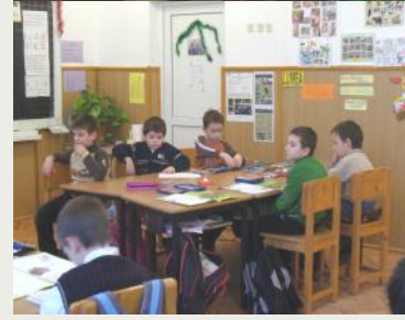
Imagini din lecțiile FUNecole